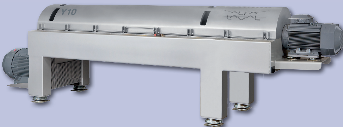
Φυγοκεντρικός Διαχωριστήρας - Decanter Y10

Φυγοκεντρικοί Διαχωριστήρες - Decanter υψηλής απόδοσης Y2, Y8, Y9 και Y10